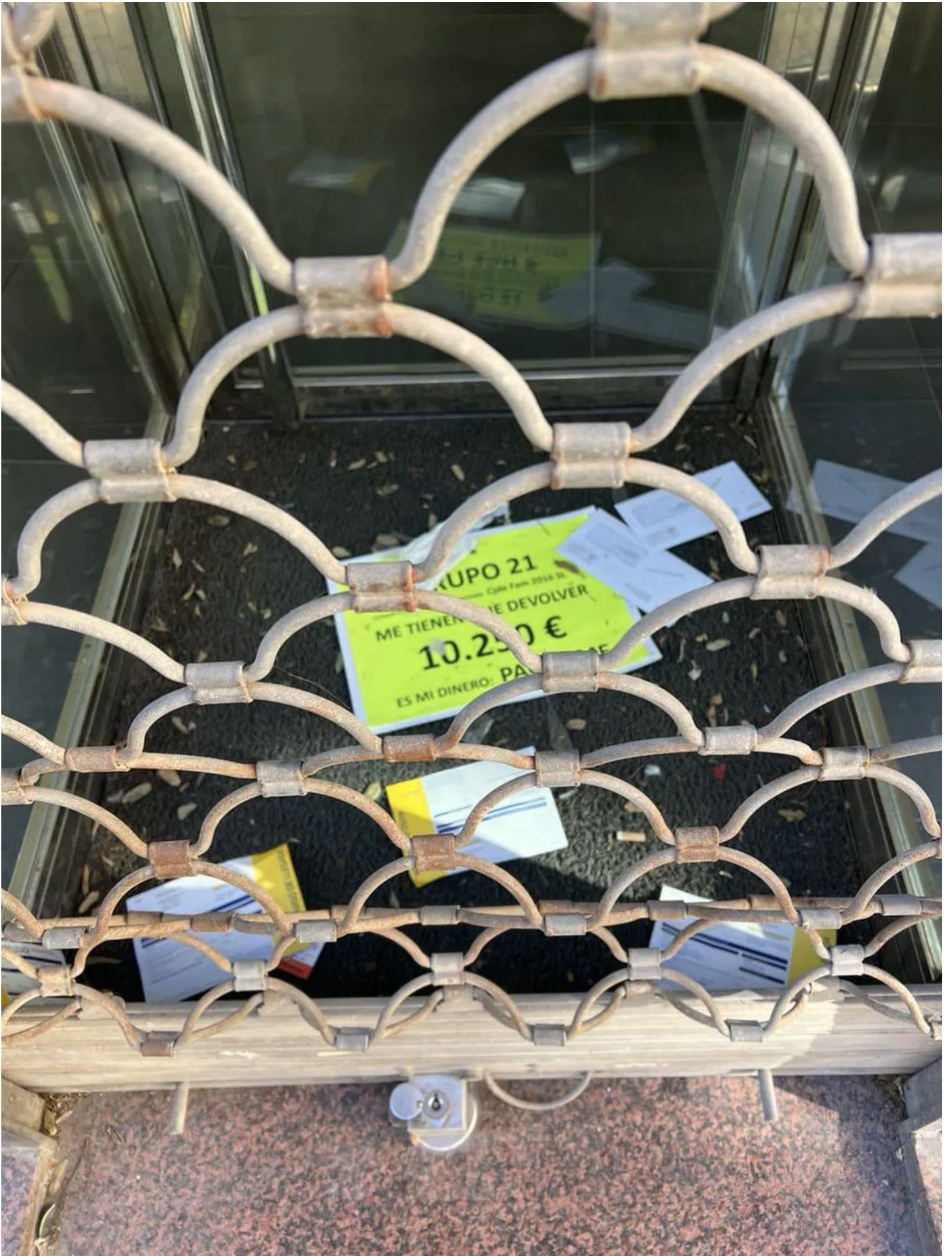
Octavillas de protesta ante la sede de la empresa denunciada.